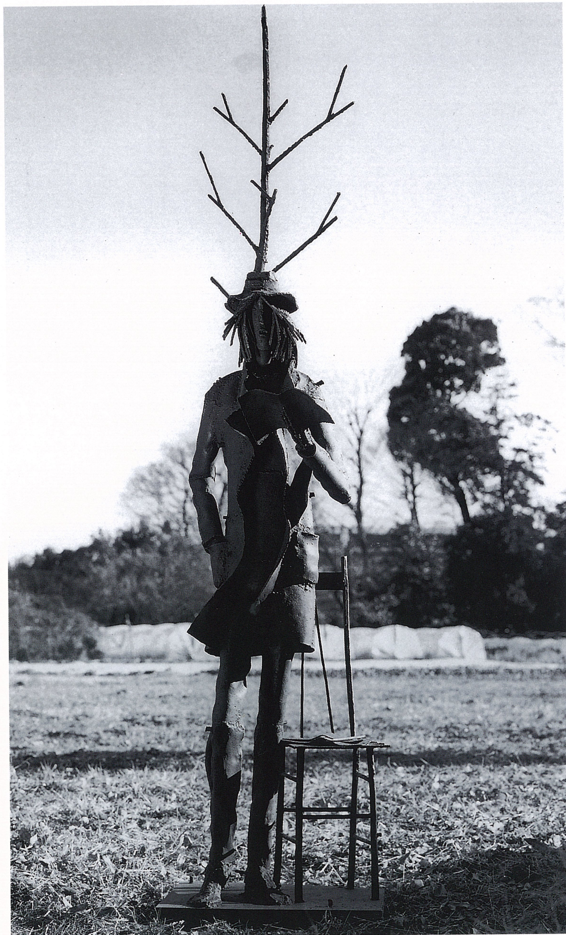
「詩人一詩想の時」 W2700×D660×H900mm コールドレン鋼 Stee