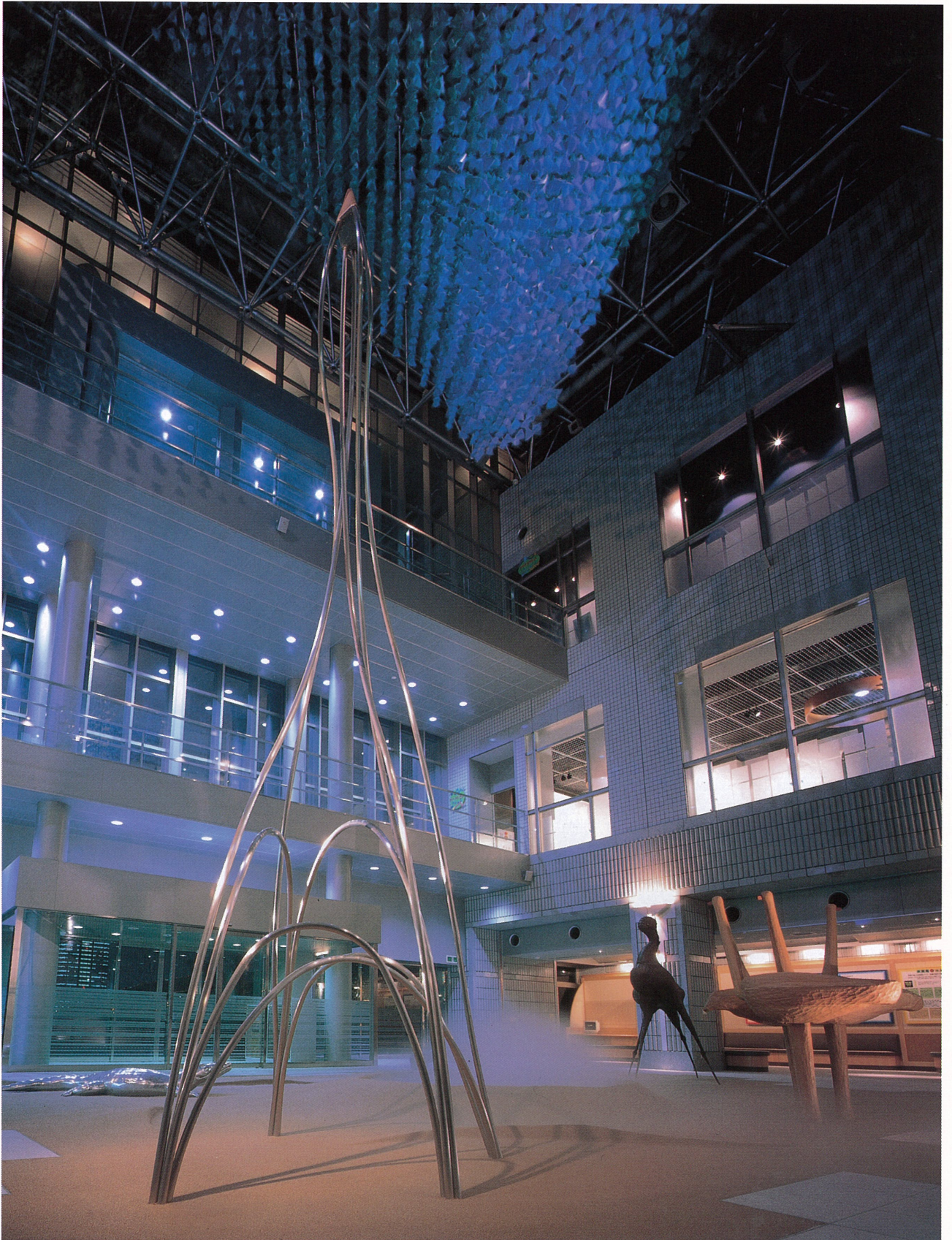
水に集う生命 1997 東京都水の科学館アトリウム空間造形計画 アートディレクション&キュレイト